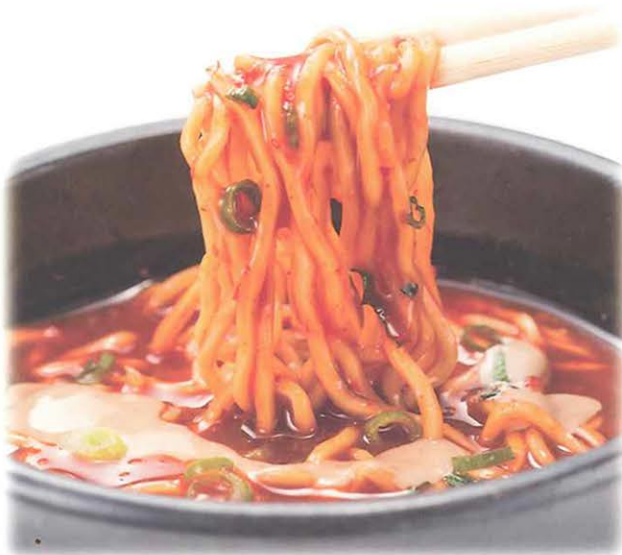
火鍋だし 担々麺 (中華麺をご注文ください)

火鍋だしに中華麺を入れ、お好みですりごまと絶品フォアグラごまだれを入れると濃厚で一度食べたら忘れられない味に。