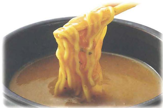
カレーだし カレーラーメン (中華麺をご注文ください)

豆乳だしにごはんと玉子、チーズを加えた、とろ〜り濃厚なリゾット。野菜やお肉から溶け出ただしが効いて深みのある味わいです。