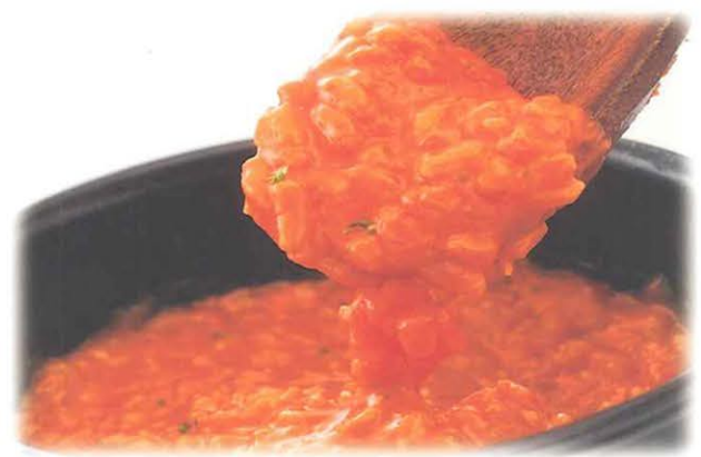
トマトだし トマトチーズリゾット