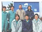
林牧場のみなさん

霜降りが入っていて、 食べる時にほどよくやわらかい。 こだわりの飼料と飼育環境で育つ 赤城山麓・林牧場のもち豚は、 まさにしゃぶしゃぶのための豚肉です。