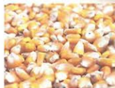
新鮮で栄養たっぷりの飼料