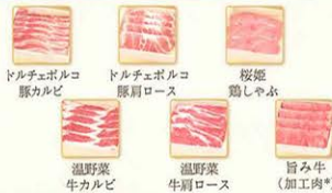
ドルチェポルコ豚カルビ ドルチェポルコ豚肩ロース 桜姫鶏しゃぶ 温野菜牛カルビ 温野菜牛肩ロース 旨み牛（加工肉*）