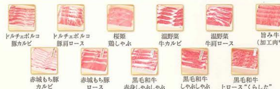
ドルチェポルコ豚カルビ ドルチェポルコ豚肩ロース 桜姫鶏しゃぶ 温野菜牛カルビ 温野菜牛肩ロース 旨み牛（加工肉*） 赤城もち豚カルビ 赤城もち豚肩ロース 黒毛和牛赤身しゃぶしゃぶ 黒毛和牛しゃぶしゃぶ 黒毛和牛上ロース“くらした”